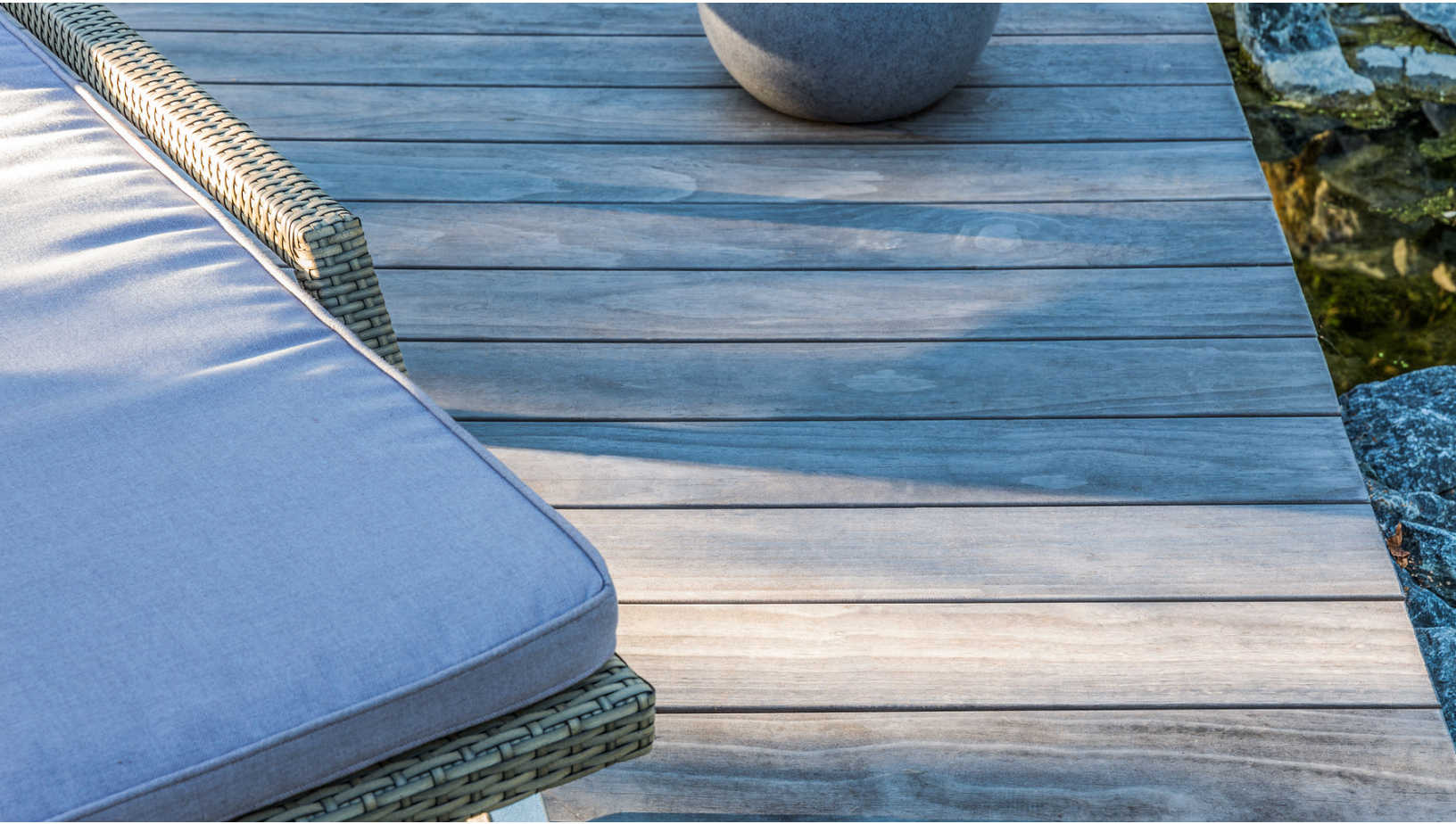
Kebony Deck beim Elbstrand Resort Krautsand